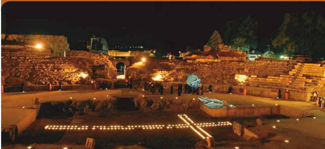
Semana Santa de Mérida. Fiesta de Interés Turístico Internacional (Vía Crucis en Anfiteatro romano).