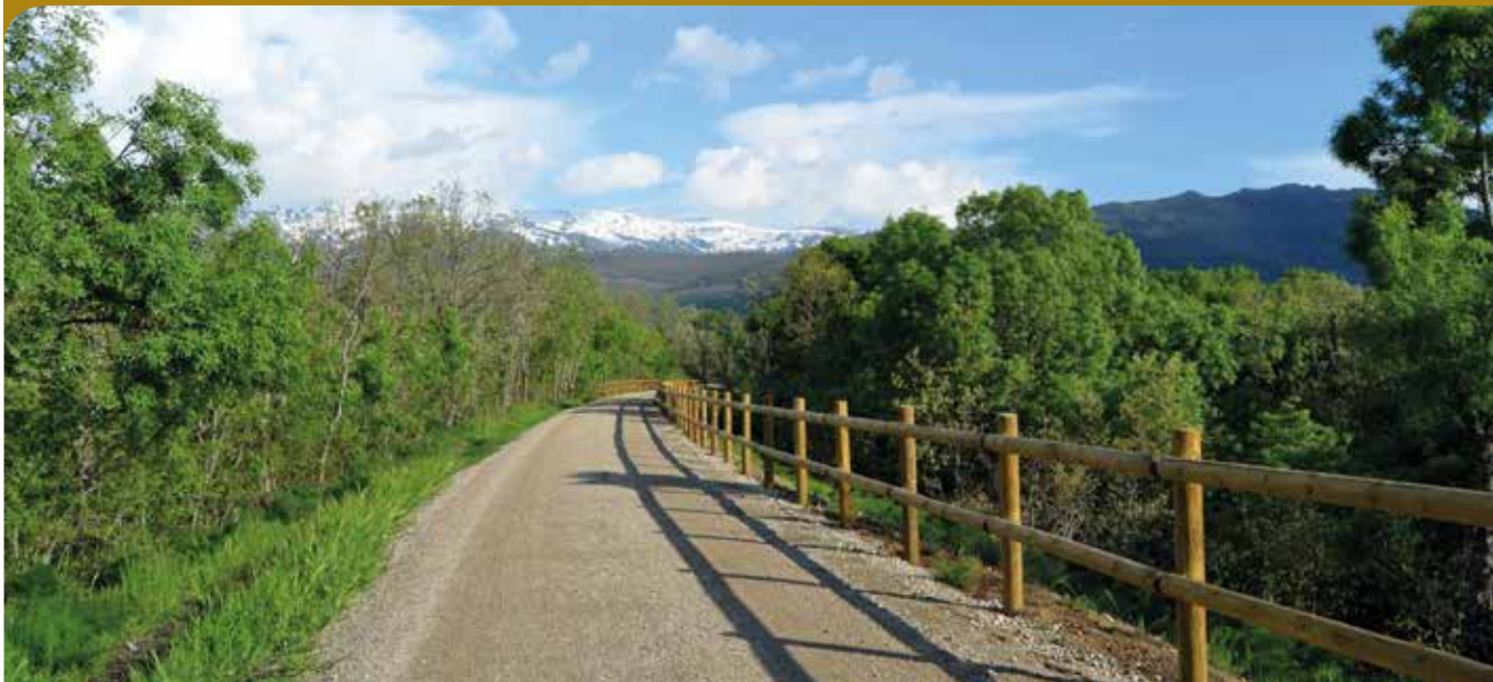
Vía Verde. Camino Natural y Sierra de Béjar – La Covatilla.