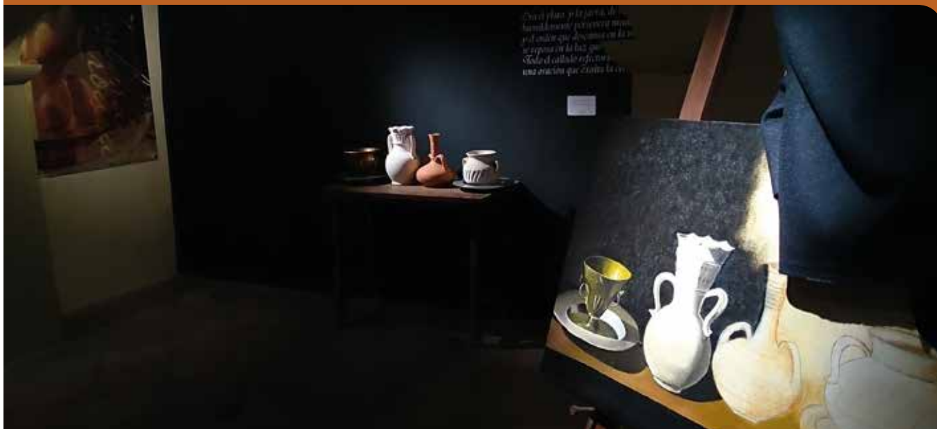
Casa-Museo Pintor Francisco de Zurbarán.