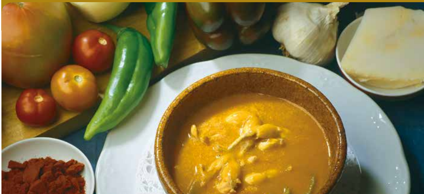
Ancas de rana en salsa bañezana.