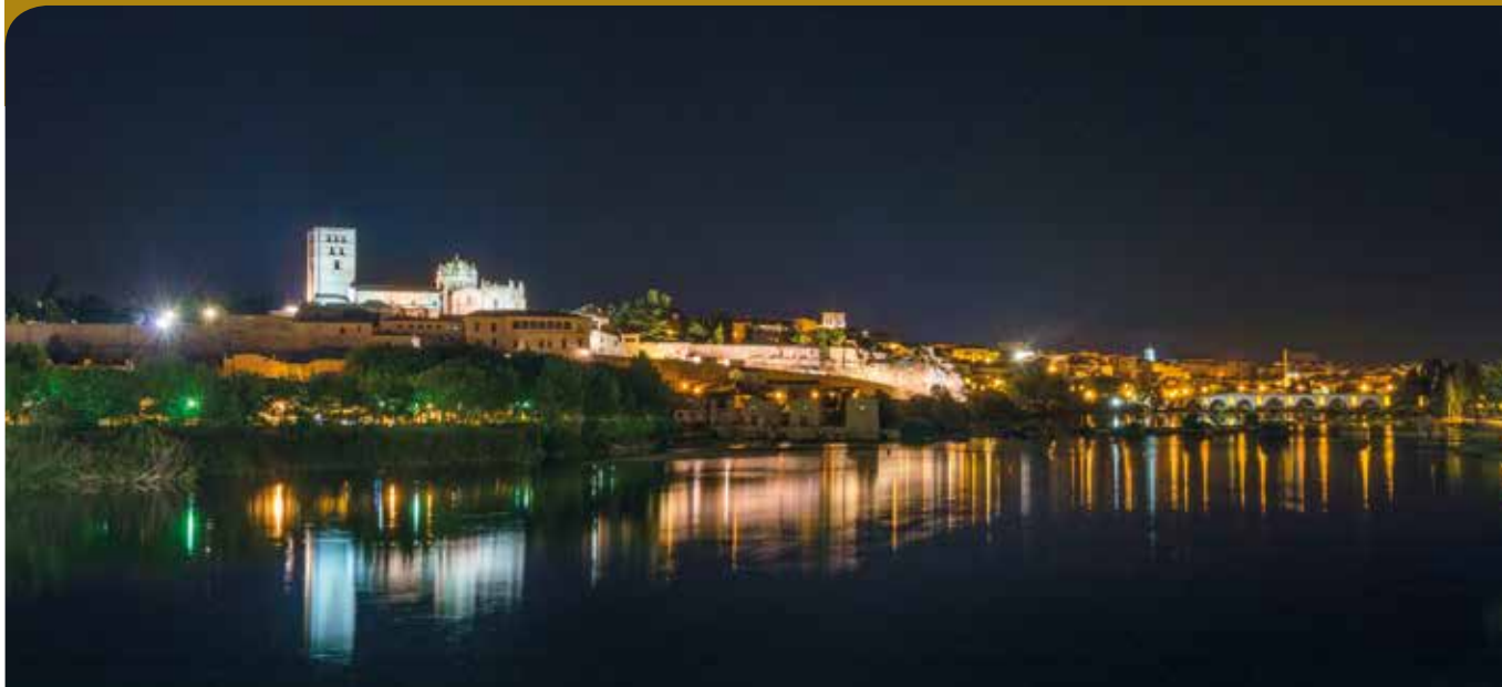
Zamora desde Puente Poetas.