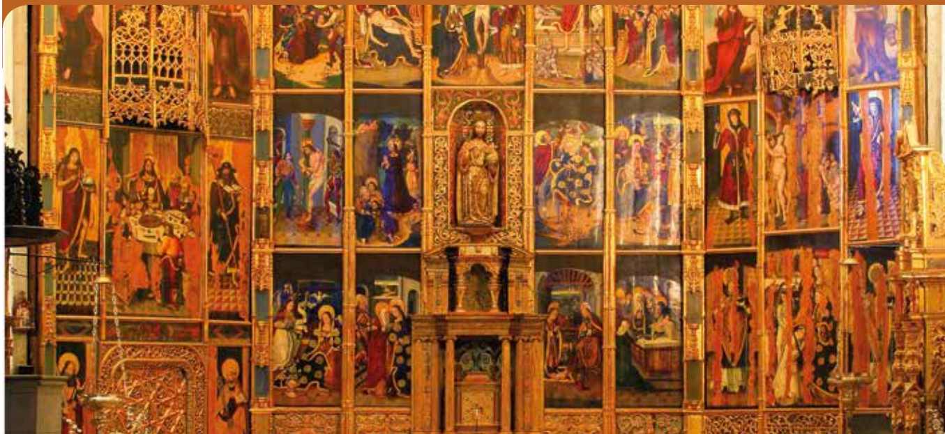
Retablo Gótico Mudéjar (S.XV- XVI).