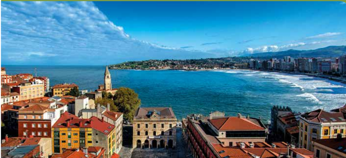
Playa de San Lorenzo desde Cimavilla.