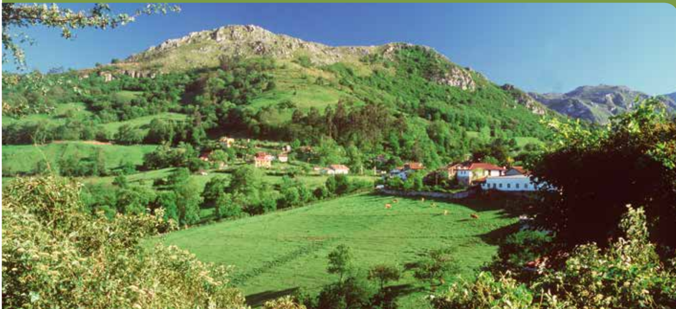
Pueblo de Sardín.