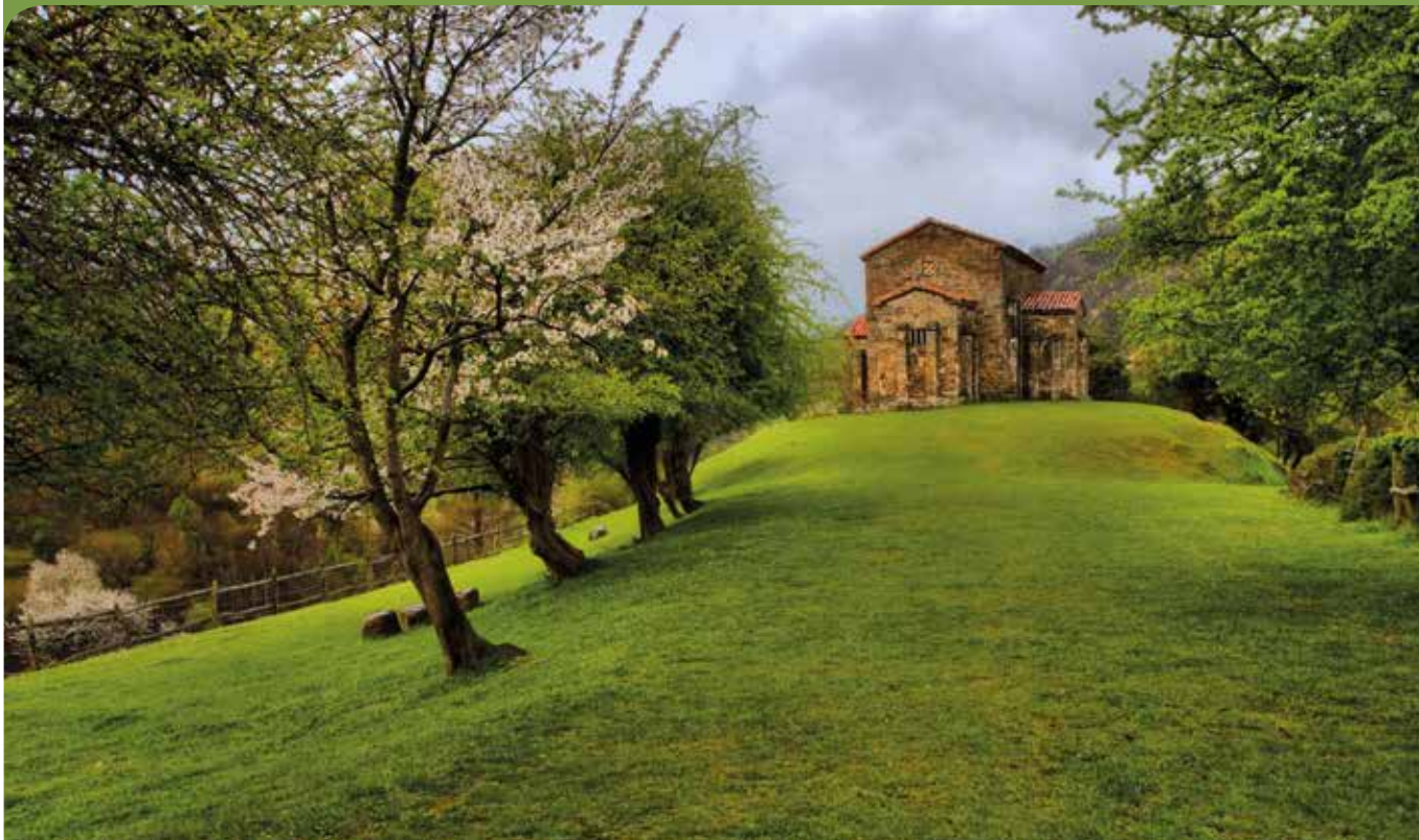
Santa Cristina de Lena, Concejo de Lena.