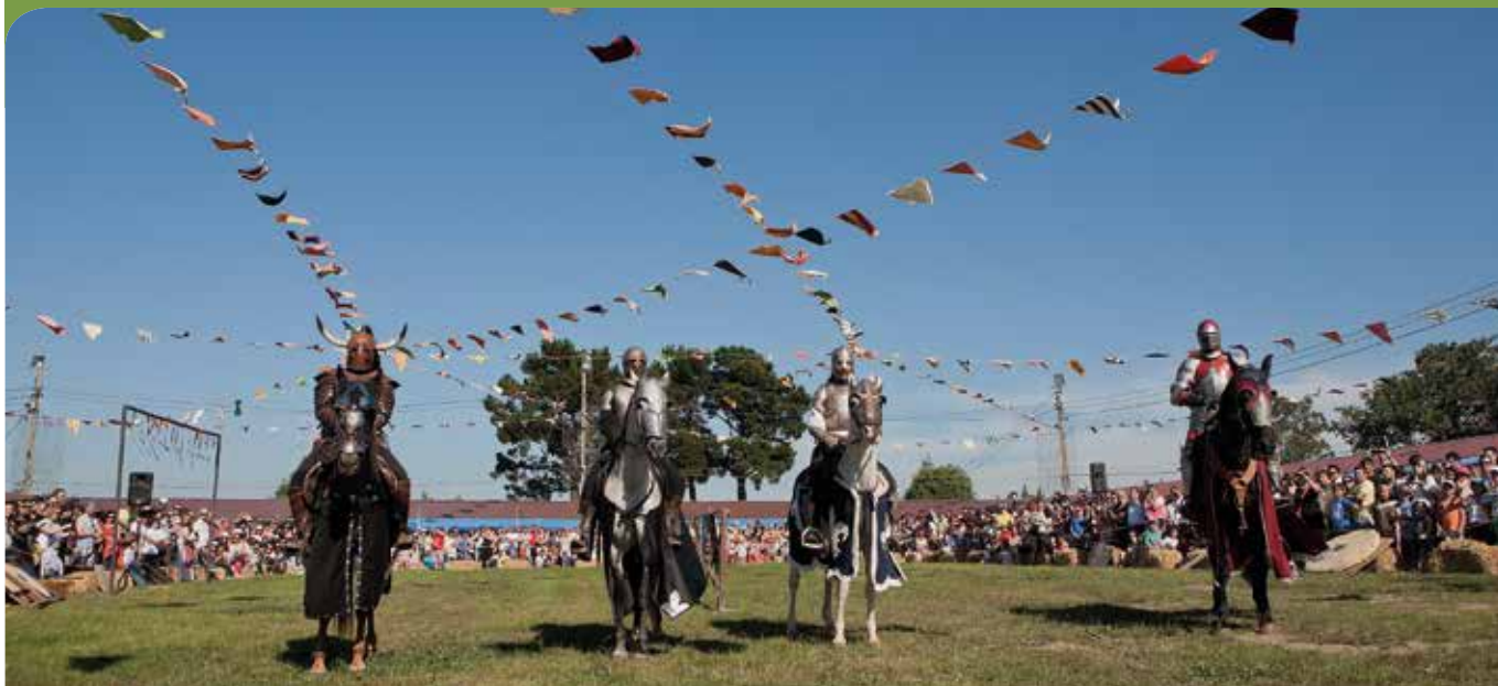
Fiesta de los Exconsuraoos, cita festiva por excelencia del verano en el municipio.