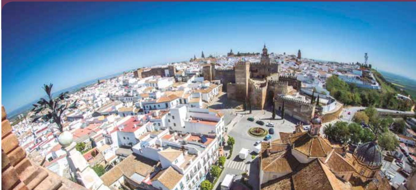
Vista general de Carmona.