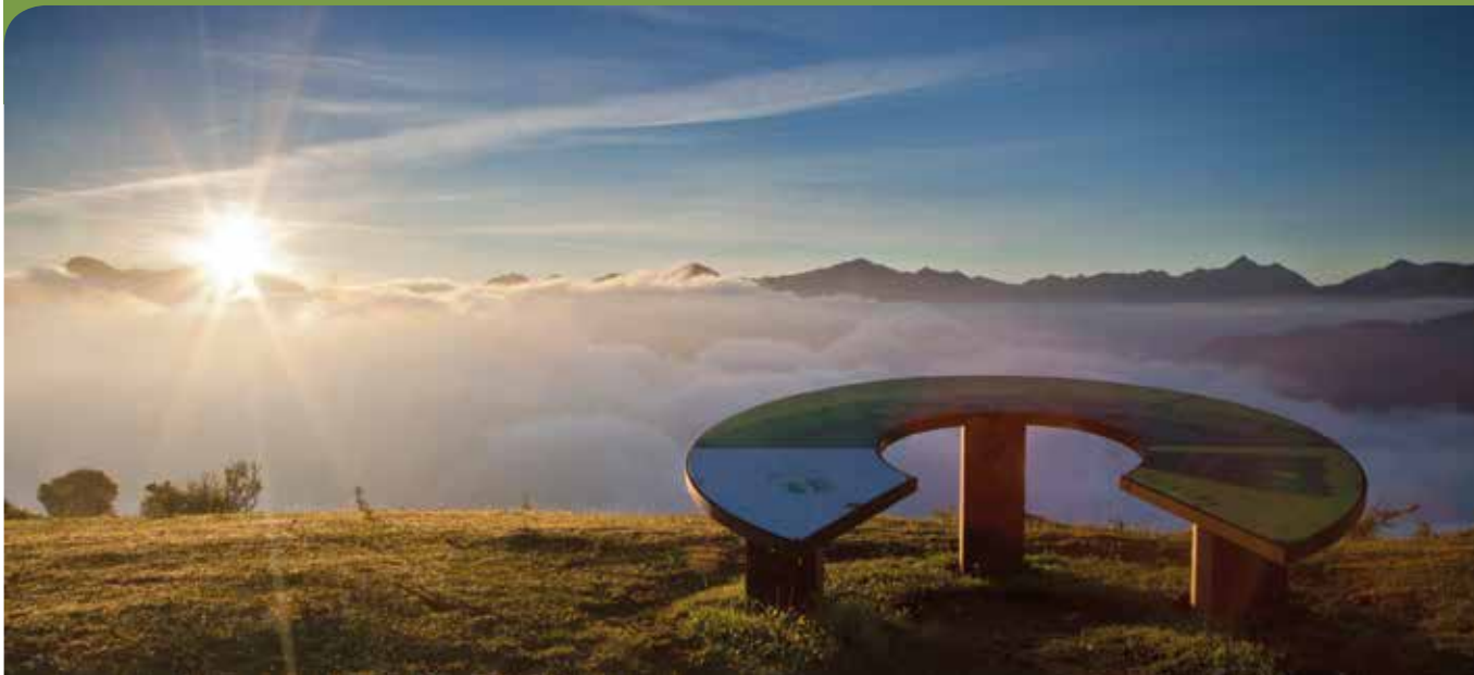
Mirador de Coto Bello