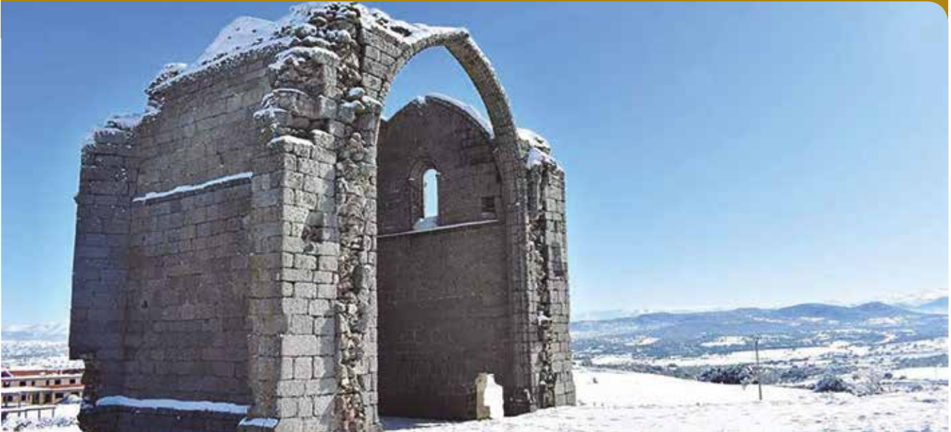
Torreón de Guijuelo