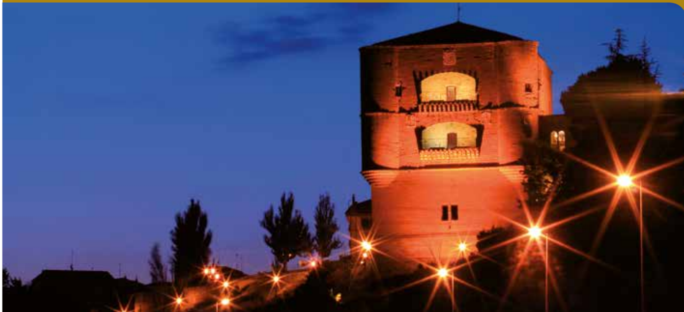
Castillo de la Mota. Torre del Caracol. Benavente.