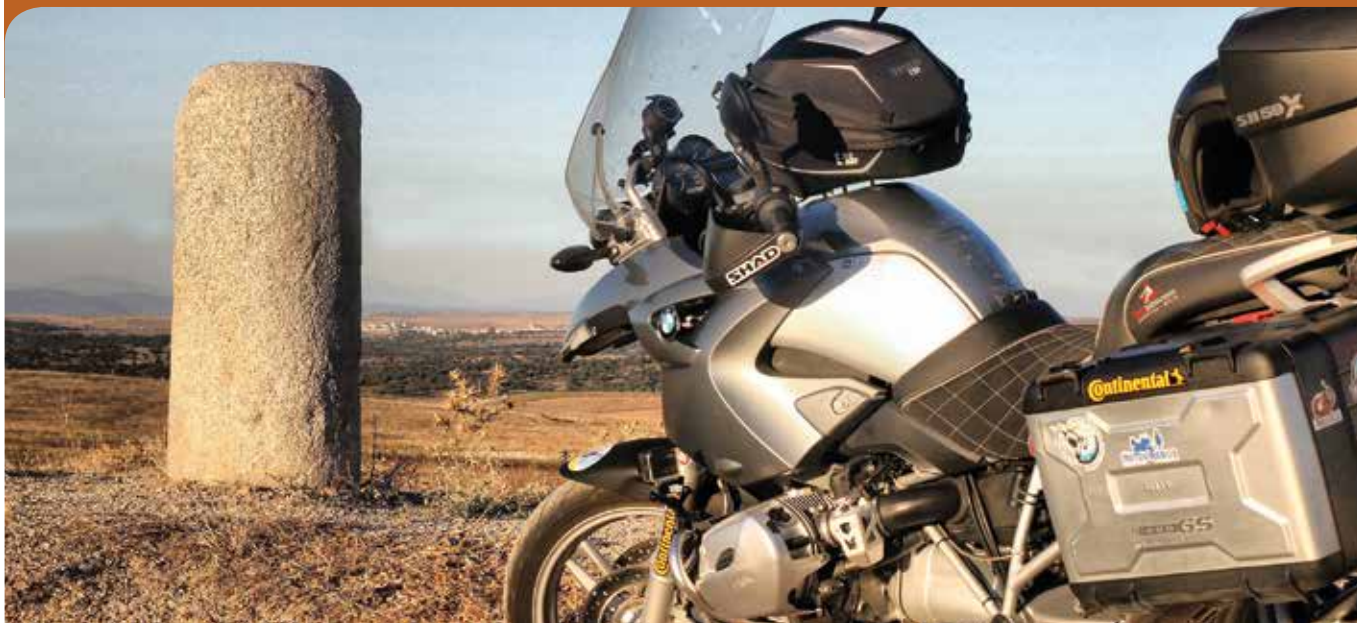
Nuevo miliario restituído en la Vía de la Plata.