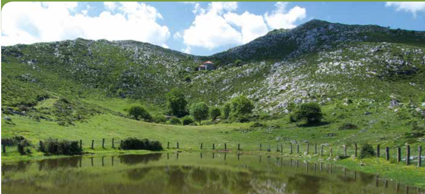
Ermitas del Monsacro.