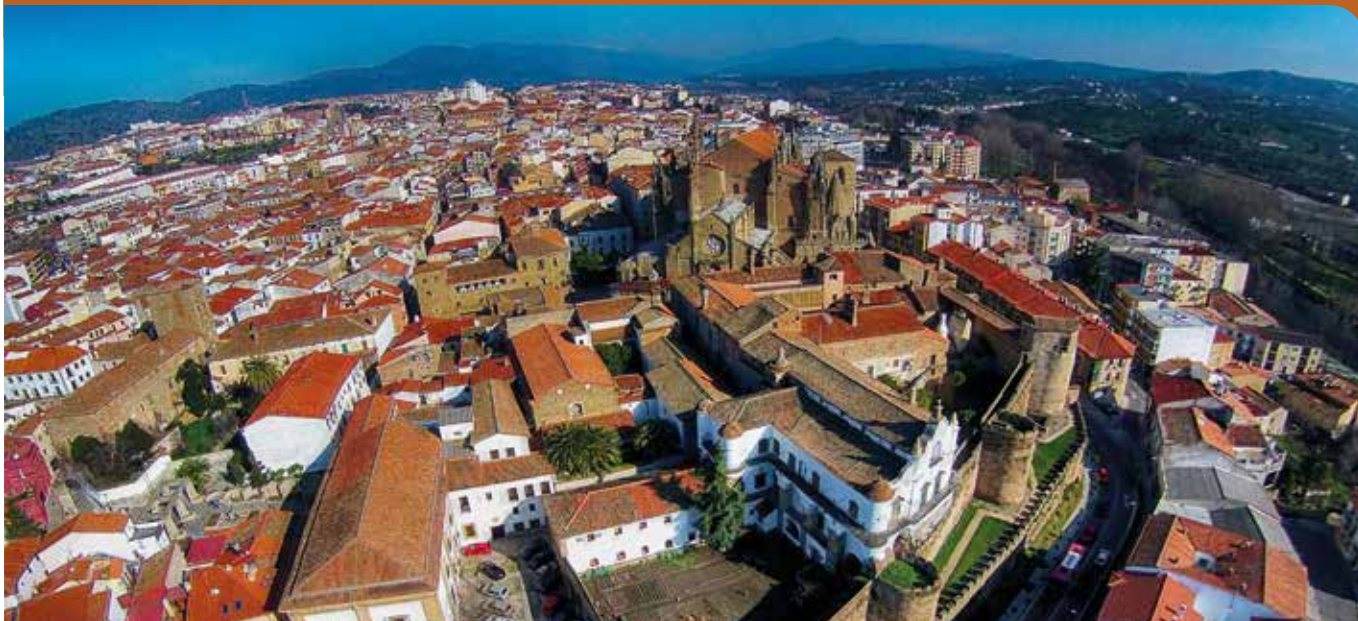
Vista aérea zona Palacio Episcopal.