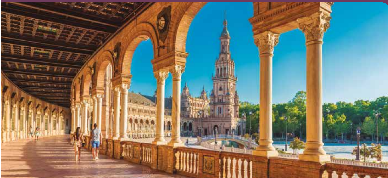
Plaza de España, Sevilla.