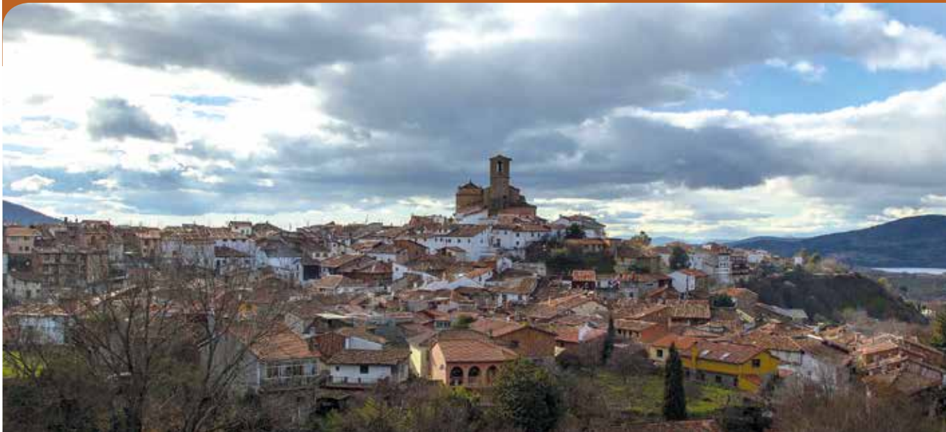
Vista general desde el mirador del Puente de Hierro.