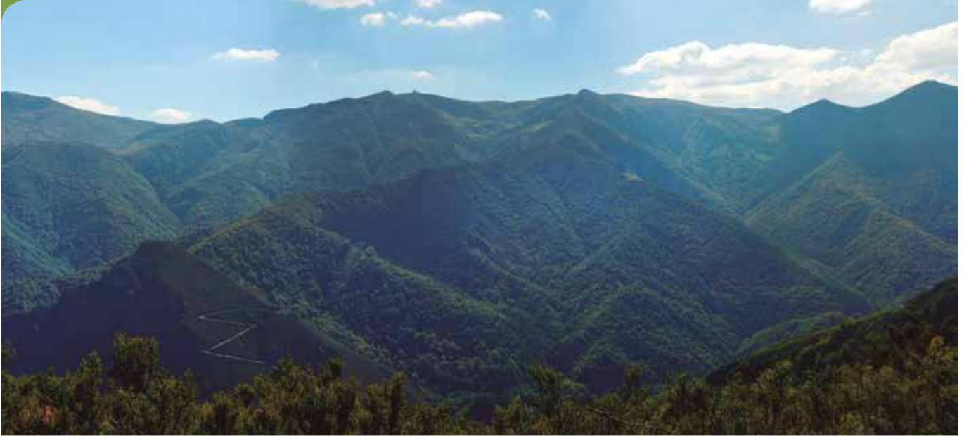
Bosque de Valgrande, en la Reserva de la Biosfera de Las Ubiñas-La Mesa.