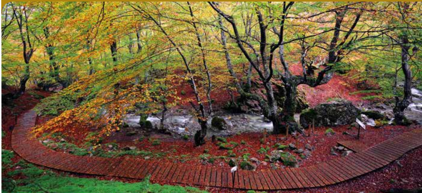
Faedo de Ciñera, premio al Bosque mejor cuidado (MAGRAMA) Autor: Miguel Aguilar.