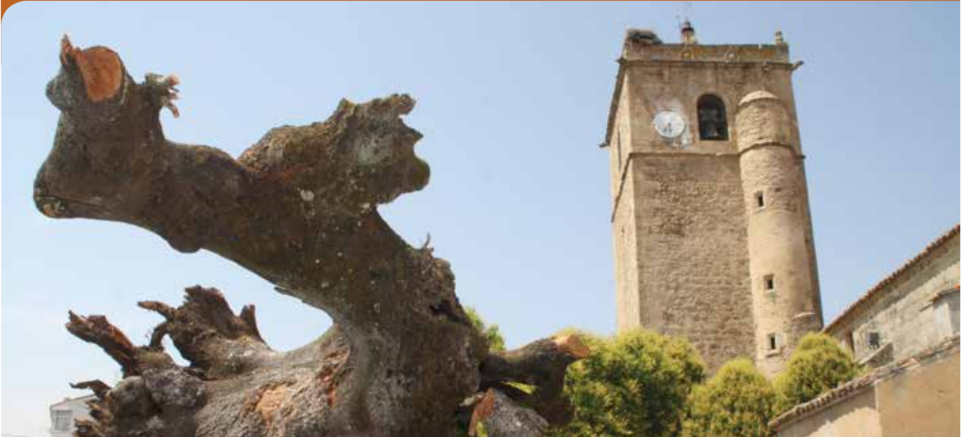
El Tuero. Tradición y Cultura.