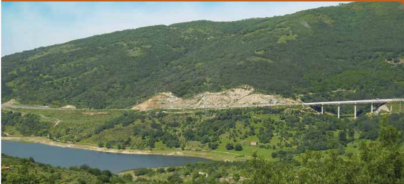
Ruta del Pantano de Baños y la Calamorcha desde el Mirador de la Estación.