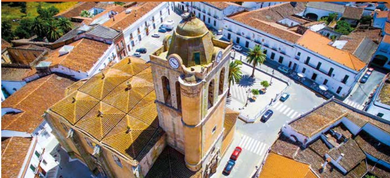
Plaza de España.