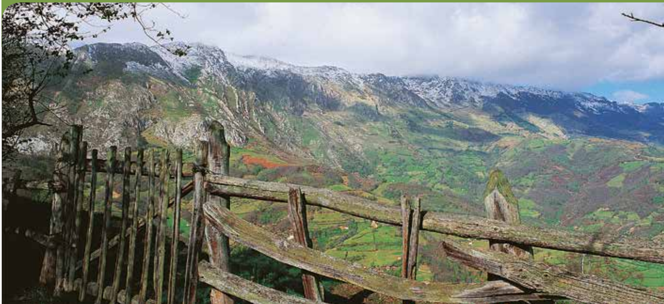
Vista de la Sierra del Aramo.