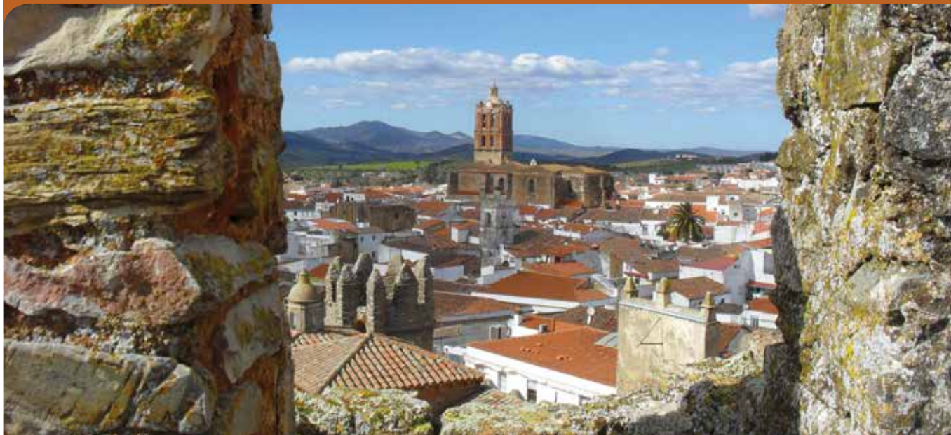
Panorámica desde las almenas de palacio.